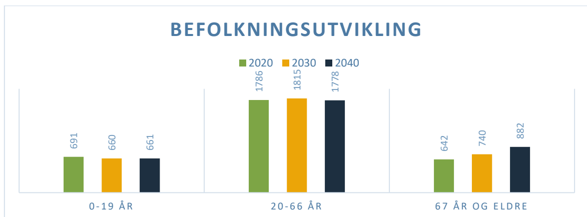
Figur 2: Dagens folketall og befolkningsframskriving i SSB sitt middelalternativ for år 2030 og 2040, fordelt på fra 0-19 år, 20-66 år og 67+.

Av 3119 innbygger ved utgangen av 2019, var 1565 sysselsatte, halvparten av kommunens innbyggere. Av disse pendler 878 ut av kommunen, underkant av 30 %. Det er 1084 sysselsatte med arbeidssted i kommunen, en reduksjon på 132 siden år 2000. 397 pendler inn til kommunen. 63% av kommunens innbyggere i arbeid, arbeider i egen kommune.