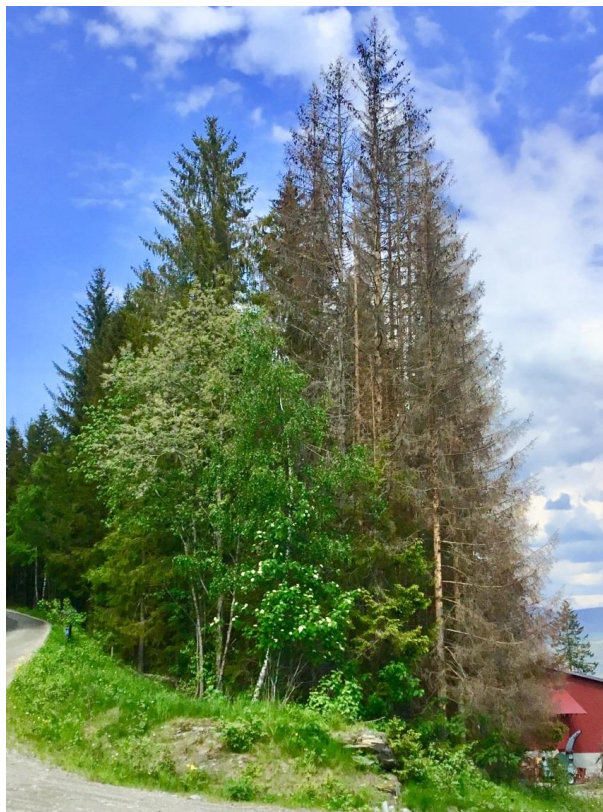
Figur 1: Bildet viser et typisk eksempel på en liten klynge med grantrær som har blitt drept av barkbiller nå i år. Bildet er fra Vestsida på Fåvang.

Det er stadig et mer vanlig syn med små klynger av gran som gradvis blir brune i baret og dør. I Ringebu og Sør-Fron er det nok spesielt på baksida at en kan se en del slike klynger med døde og døende grantrær. Disse trærne har blitt angrepet og drept av barkbiller. Hvis en går nært inn på de døde trærne kan en se rikelig med borehull gjennom barken, og store mengder brunt boremel nedover stammene og på bakken rundt trærne. Dette viser tydelig at det er granbarkbillene som har drept trærne.